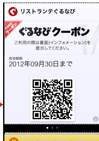
「Passbook」利用画面イメージ