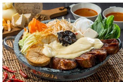
▲とろとろ焼きチーズの麻辣石焼鍋