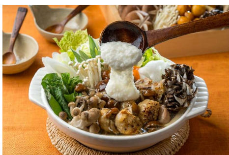
▲大なめこ・なめたけの温活とろろ鍋

■ “とろみ鍋™”定義 トレンド鍋® ブランドサイト https://trendnabe.gnavi.co.jp/ 具材やスープを工夫し、とろみをつけることで、冷めにくく身体を芯からあたためる鍋。出汁にとろみをつけあんかけ風にしたり、キノコやとろろ、チーズなどの具材を使用してとろみをつけた鍋。