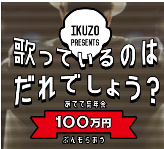
キャンペーンサイトイメージ

日本の忘年会を盛り上げるべく結成された期間限定の謎の男女ユニット「ボーンズ」による、二人が織りなす愛のデュエットソング「じゃあ忘れましょう」を聞き、白いハットの下に隠されたこの男性歌手の正体が誰なのかクイズに答えて応募すると、全国共通お食事券「ぐるなびギフトカード」100万円分が1名様に当たります。男性歌手の正体は、声に特徴のある大御所歌手です。音楽の力で、忘年会のメッセージを広めていきます。