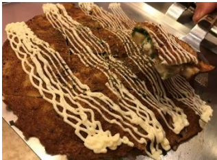
智 伊勢丹店 べら焼き