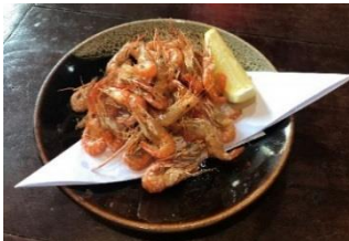
なぎ屋 トンロー通り店 川海老揚げ