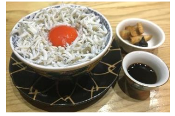
喜多郎寿し 裏pronpon店 かまあげしらす丼