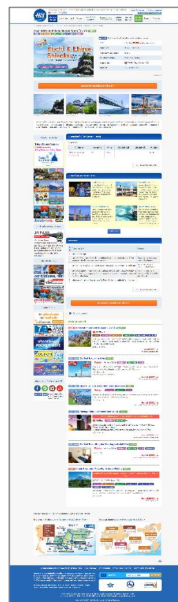
高知県ツアー商品販売ページ