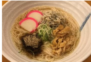
歌行燈 エンポリウム店 中日そば