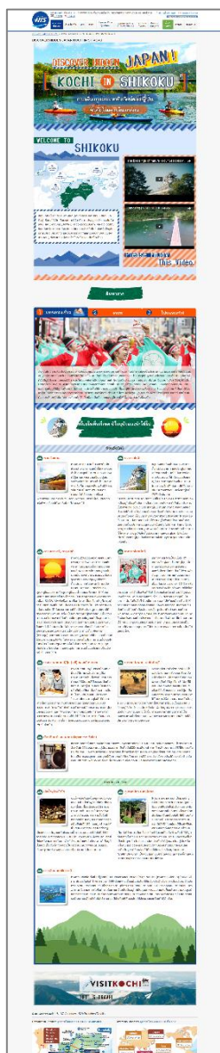
高知県PRページ（観光）