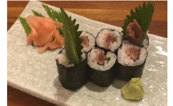
しゃかりき432" ニュートンロー店 土佐巻き