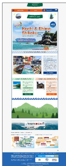
高知県PRページ（ツアー商品）