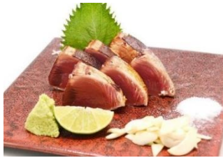
てっぺん エカマイ店 高知県産カツオのわら焼き