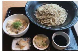
生そば あずま 貝めし（そば定食）