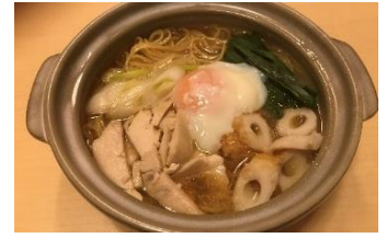
たけいち K-Village店 鍋焼きラーメン