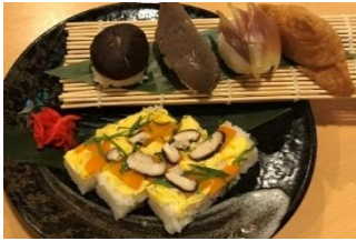
土佐炉ばた 八金 裏pronpon店 こけら寿司と田舎寿司のセット