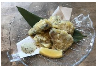
原始焼 スクンビット26店 高知県産カツオ竜田揚げ