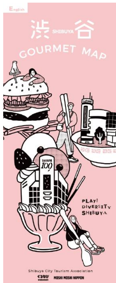
↑「渋谷 GOURMET MAP」表紙

←各店舗情報には住所、電話番号、平均予算などの基本情報のほかに、「英語メニュー」「英語スタッフ」「Free Wi-Fi」「クレジットカード」の対応状況を分かりやすくアイコン表示(図右下)