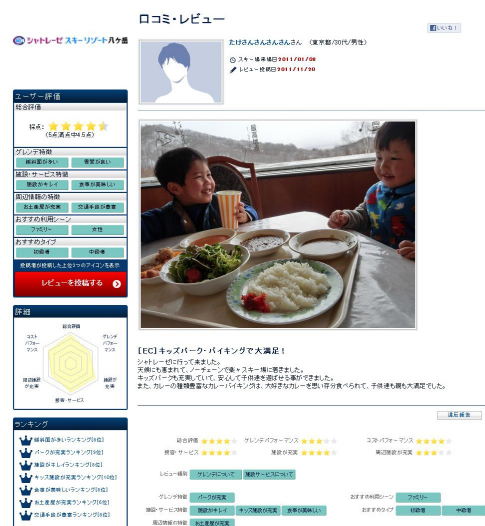
口コミ・レビュー内容の詳細画面イメージ

<本件に関するお問い合わせ> 株式会社ぐるなび 総合政策室 広報 担当:栗田、羽田野 MAIL: pr@gnavi.co.jp TEL: 03-3500-9700 FAX: 03-3500-9743