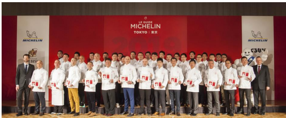
▲昨年「ミシュランガイド東京 2019」出版記念パーティーの様子

当日は、星付き、ビブグルマンなど『ミシュランガイド東京 2020』に掲載される店舗の発表シーンをご覧いただけるほか、会場にはフォトブースや限定グッズのブースなどが並び、緊張感漂う中、世界中が注目する『ミシュランガイド東京 2020』発表の記念すべき瞬間を特別に体験いただくことができます。