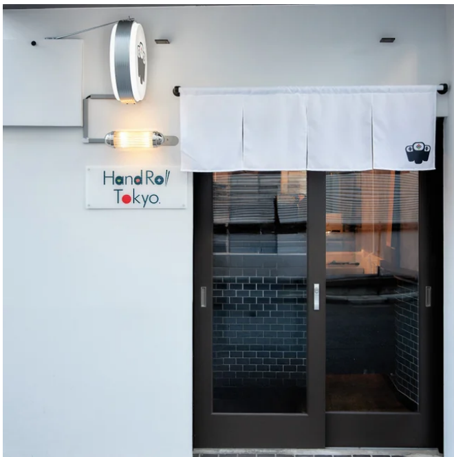
巻き寿司専門店でありながら、カフェのような店舗