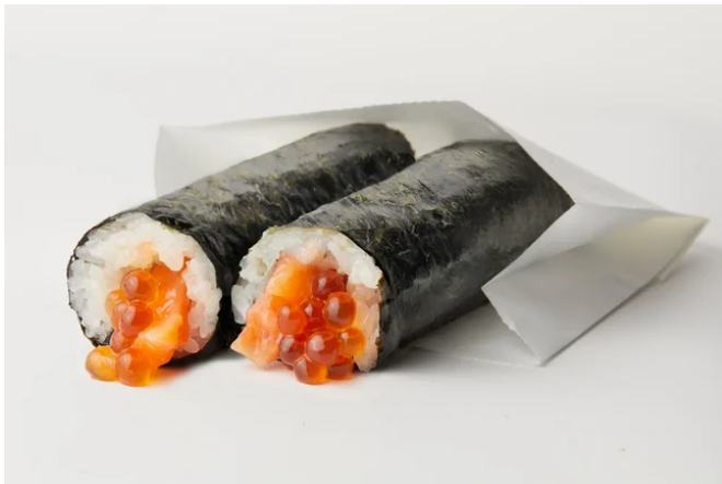
1番人気のサーモンいくら

また、塩分が強すぎない上で、醤油の風味を感じることができるのでネタやシャリの味を引き立てます。※一部の商品は醤油ベースのスパイスを使用しております。