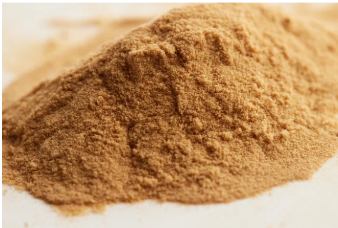
醤油の風味を十分に感じる事ができる粉末醤油