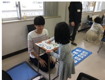
神経衰弱トランプゲーム