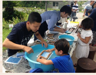
牛乳パック紙すき体験