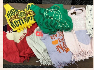
Tシャツでエコバッグづくり