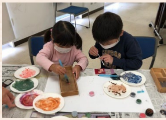
余った化粧品でお絵かき

牛乳パックやTシャツ、ペットボトルキャップ、化粧品など、身近なものを用いた作品作りやゲームが体験できるエコまつりを開催します。こどもたちのエコ意識を育むとともに、完成した作品は持ち帰り、日用品や遊び道具として楽しむこともできます！