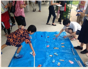
ごみ分別魚釣りゲーム