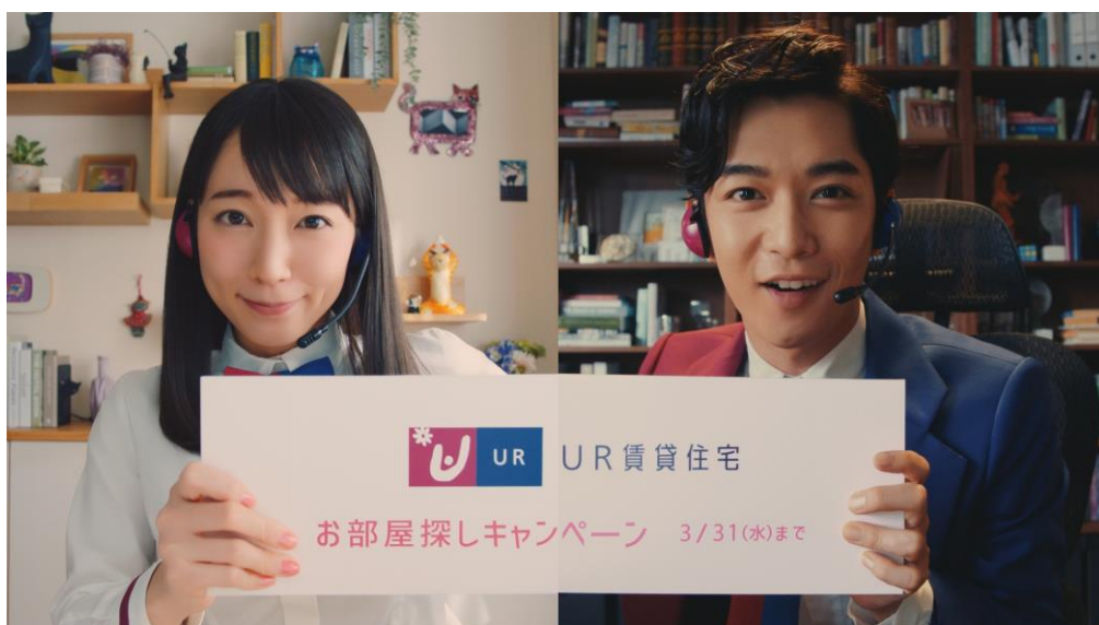
新TV-CM「テレワーク(礼金・仲介手数料ナシ)」篇より

URL: https://www.ur-net.go.jp/chintai/campaign/2021/spring/