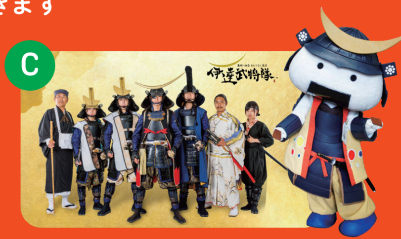
C 伊達武将隊&むすび丸と 仙台街歩き