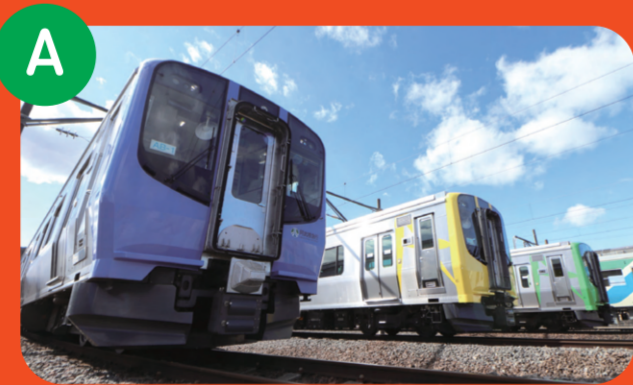
A 阿武隈急行 満喫体験

仙台・宮城を堪能できる15万円相当の「選べるみやぎ体験」プレゼント！※写真は全てイメージです ABCの中から一つお選びいただきます