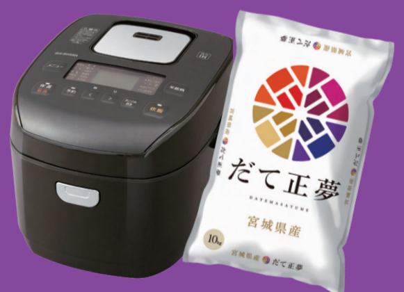
優秀賞(4点)には アイリスオーヤマ炊飯器と だて正夢(10kg)を プレゼント！