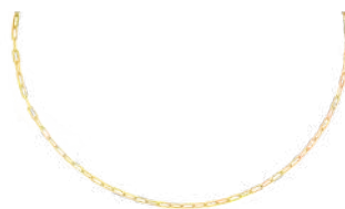
24K VERMEIL 45 to 55 cm ¥59,400