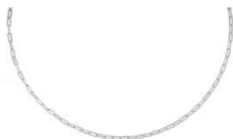
925 SILVER 45 to 55 cm ¥35,200