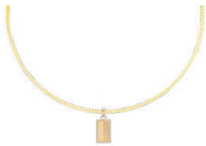
PETIT 25 x 15 mm ¥19,800