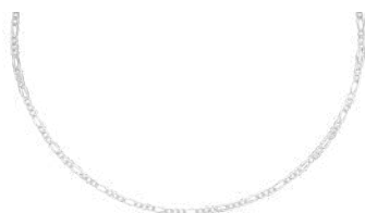
925 SILVER 45 to 55 cm ¥35,200