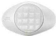
925 SILVER ANTIQUE MOP 14 / 16 / 18 / 20 / 23 ¥44,000

フェリックスリングは、創業者の息子フェリックスに由来するラウンド型シングネットリングで、ファグランアトリエの豊かな歴史と職人技を讃えています。アンティークの白蝶貝にはダイヤモンドカット技法で繊細な市松模様が彫り込まれ、白蝶貝の工房としての起源を象徴しています。クラシカルな白蝶貝の輝きとチェック柄のコントラストが、伝統的な技術と現代的なデザインを融合させ、125年以上にわたるラグジュアリージュエリーの歴史を讃えています。