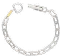
925 SILVER S / M / L ¥37,400