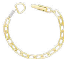
24K VERMEIL S / M / L ¥48,400