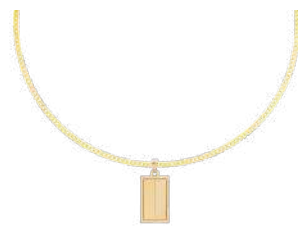
GRAND 35 x 20 mm ¥24,200