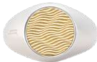
TWO-TONE 925 SILVER 24K GOLD 14 / 16 / 18 / 20 / 23 ¥38,500