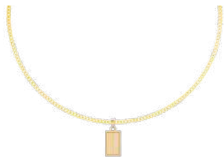
PETIT 25 x 15 mm ¥19,800