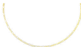
24K VERMEIL 45 to 55 cm ¥59,400