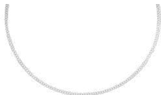
925 SILVER 50 to 55 cm ¥38,500