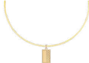
GRAND 35 x 20 mm ¥24,200