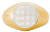
24K VERMEIL ANTIQUE MOP 14 / 16 / 18 / 20 / 23 ¥66,000