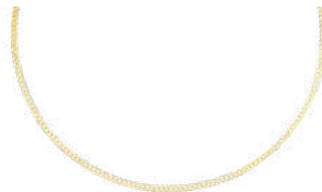
24K VERMEIL 50 to 55 cm ¥64,900