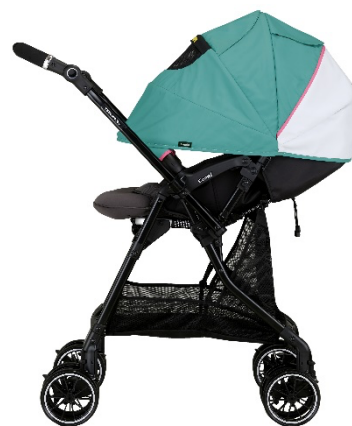
JR 東日本商品化許諾済

特 徴：軽量車体ながら、赤ちゃんに伝わる路面からの不規則な揺れを軽減するために、卵を落としても割れないほどの超・衝撃吸収素材「エッグショック」をシート全面と、頭部には枕状で搭載し、赤ちゃんの乗り心地にこだわりました。はやぶさのエクステリアデザインを象徴する「ときわグリーン」と「飛雲ホワイト」そして「つつじピンク」の帯を表現した大型幌は、夏の強い日差しから赤ちゃんのデリケートなお肌を守ります。背面間口には、伸縮するネットがついたマルチネットバスケットを搭載し、お買い物の購入品など、荷物をたっぷり収納できる仕様で、ママ・パパをはじめとする利用者の使い勝手の良さにもこだわりました。