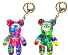
▲KIMOKUMA 3D キーホルダー