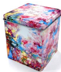
▲MIKA NINAGAWA チョコクランチ