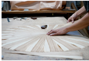
徳島特有の体験ができる ワークショップ