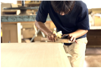
箱もの工場の見学