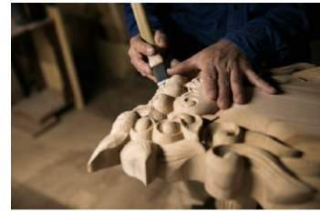
彫刻や建具の工場見学

徳島の木工メーカー 9 社がものづくりの現場を公開します。 突板張りに手彫りの彫刻、繊細な組子に厚みのある一枚板。 曲木から成形合板までと、多種多様な素材や技術が長い年月をかけて集積しています。 徳島ならではの匠の技をじっくりご覧ください。