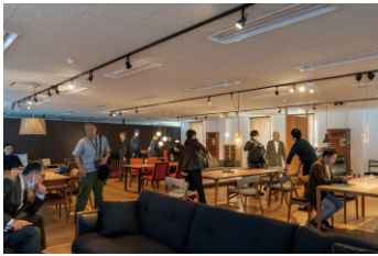
工場に付随したショールーム見学