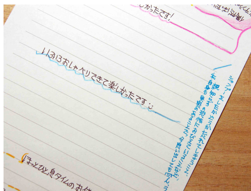
お手紙で文章力アップ