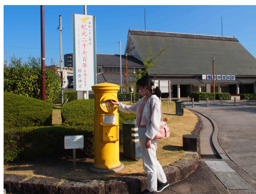
旅先から自分に絵葉書