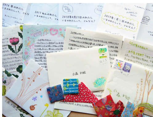
毎年春に、自分宛てにお手紙