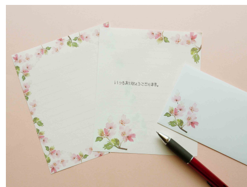
身近な人にこそお手紙