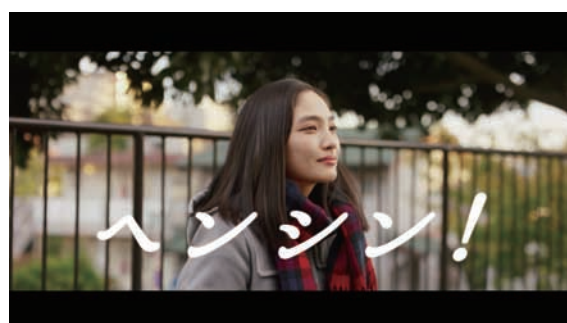
ヘンシン！「泣く女」篇 21秒 URL : https://www.youtube.com/watch?v=EmzxVrDap90