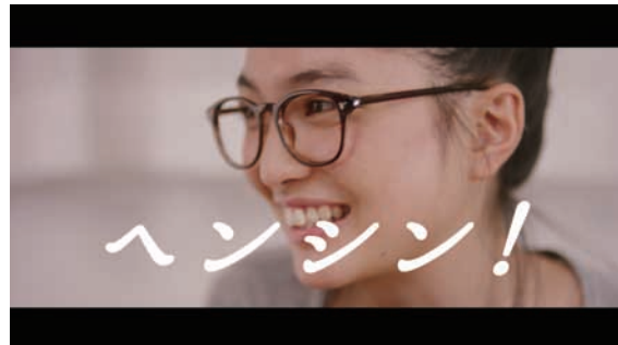
ヘンシン！「笑う女」篇 22秒 URL : https://www.youtube.com/watch?v=CNpl7_-YuK8