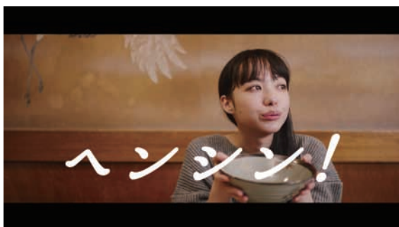
ヘンシン！「食べる女」篇 20秒 URL : https://www.youtube.com/watch?v=dcP1xCJlhkQ