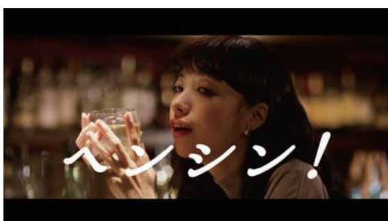
ヘンシン！「考える女」篇 23秒 URL : https://www.youtube.com/watch?v=SWZo1ndPopl