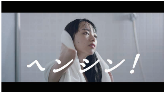
ヘンシン！「洗う女」篇 24秒 URL : https://www.youtube.com/watch?v=FVrtz8srdLs