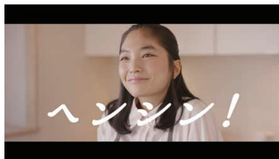
ヘンシン！「歌う女」篇 22秒 URL : https://www.youtube.com/watch?v=aPiG9e14pCc