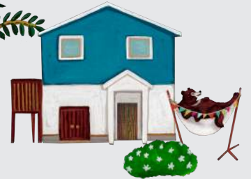
HYVÄ AND STYLE etc...