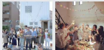
全国の「ZERO-CUBE」施主様邸で同時に ホームパーティーを開催