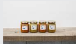
大分県産/季節の野菜と果物ジャム