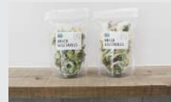
大分県産/季節の乾燥野菜