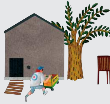
HOUSE CANVAS by IDÉE