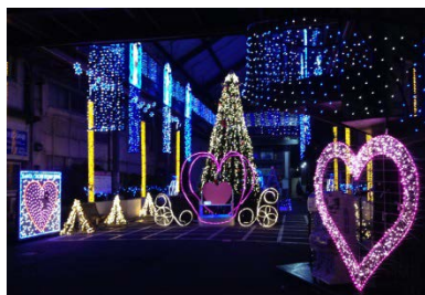
サンタクロスロード ※画像は昨年のも

イベント開催期間中には、今年も「 イルミネーションパス 」を期間限定で運行し、4か所のイルミネーション会場を結んでいます。今年は車内のイルミネーションが花のモチーフに変化するなど特に女性におススメの仕掛けが盛りだくさんで、会場までの道のりを盛り上げます。