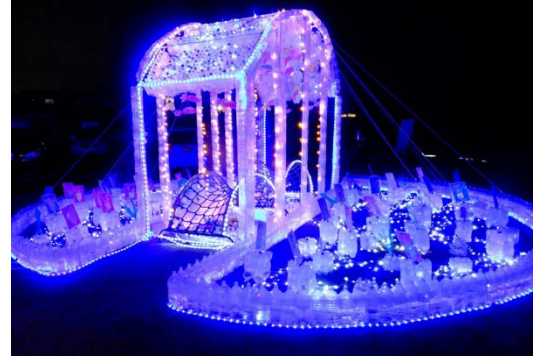
2014年度大賞：「おいでませ 竜宮城へ」 琴崎保育園