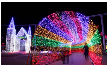
TOKIWAファンタジア ※画像は昨年のも