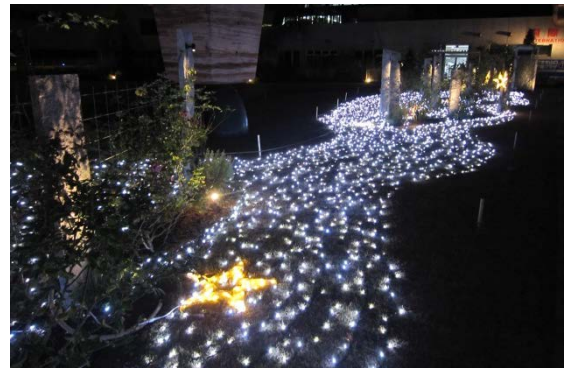
エアポート・イルミネーション ※画像は昨年のも