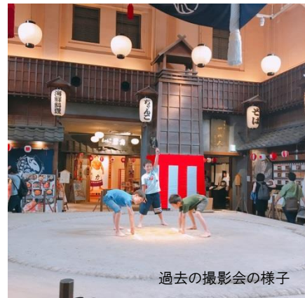
過去の撮影会の様子