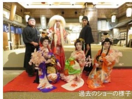
過去のショーの様子