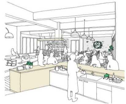
シェア型賃貸住宅

旧寮は築44年、110室の男子寮として利用されておりました。今回のリノベーション工事を経て（株）リビタが運営するシェア型賃貸住宅『シェアプレイス三鷹』となります。シェアプレイス三鷹では112人が住む大型のシェアハウスとなり、共用設備としてキッチンやシアタールーム等を計画しております。