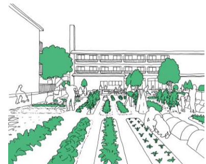
貸し農園イメージ

貸し農園は『シェア畑 リエットガーデン三鷹』として1区画約3㎡の畑を約110区画計画しております。運営事業者である（株）アグリメディア専任の「菜園アドバイザー」による生育のサポートも予定しております。