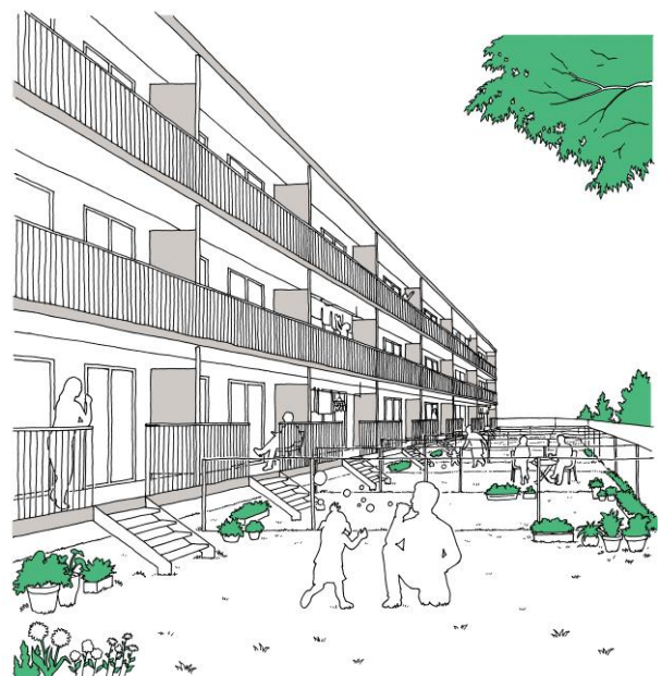
ファミリー向け賃貸住宅 専用庭イメージ