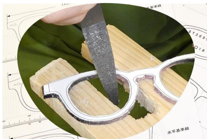
さばえめがね館 東京店

2021年4月29日（木・祝）から5月9日（日）までの期間、日比谷OKUROJIの各ショップではものづくり体験やワークショップを開催します。手作りめがね教室、伝統的な手織り体験とチーフづくり、藍染体験やアルコールストーブワークショップなど、本物の技に触れ、新しい発見や価値観に出会える体験の場を提供します。