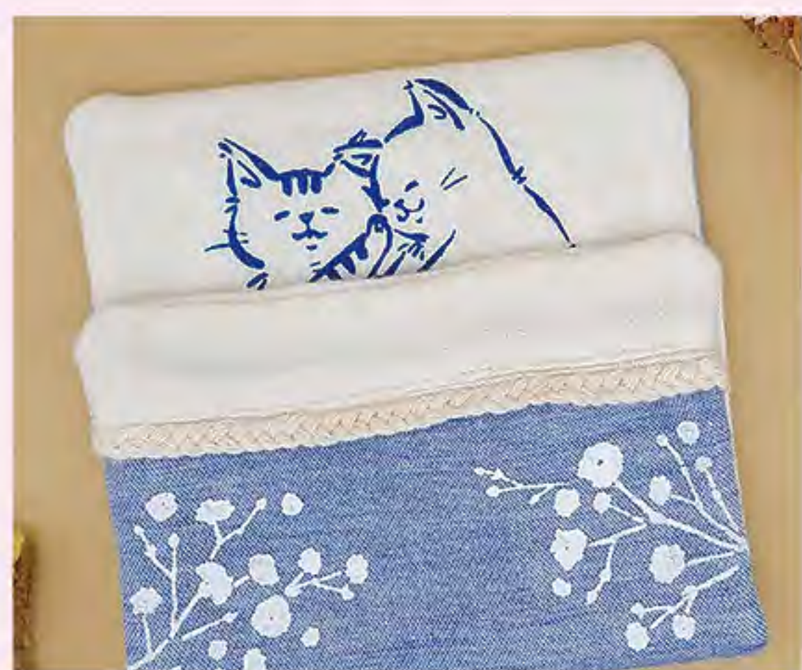
おふとんからでないねこ。