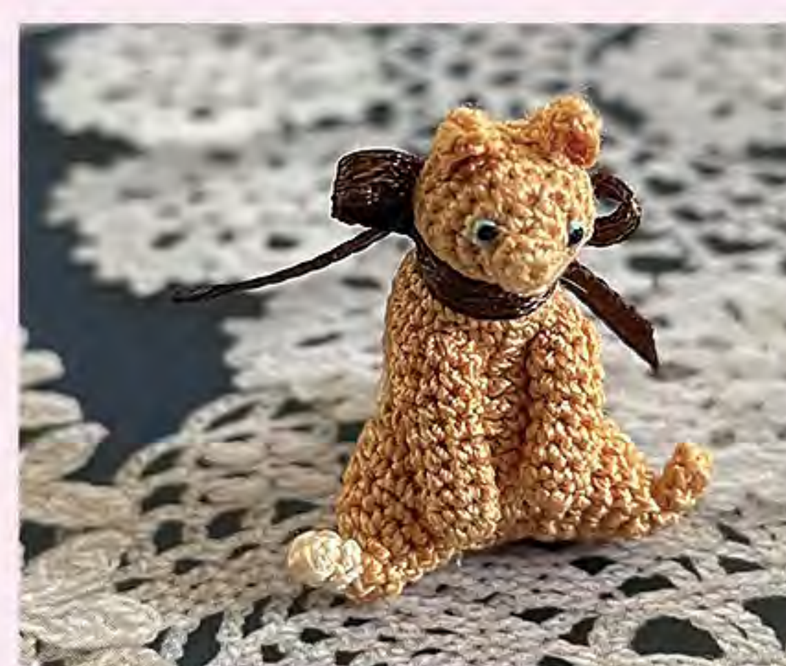
あみぐるみ mimi (23日のみ)