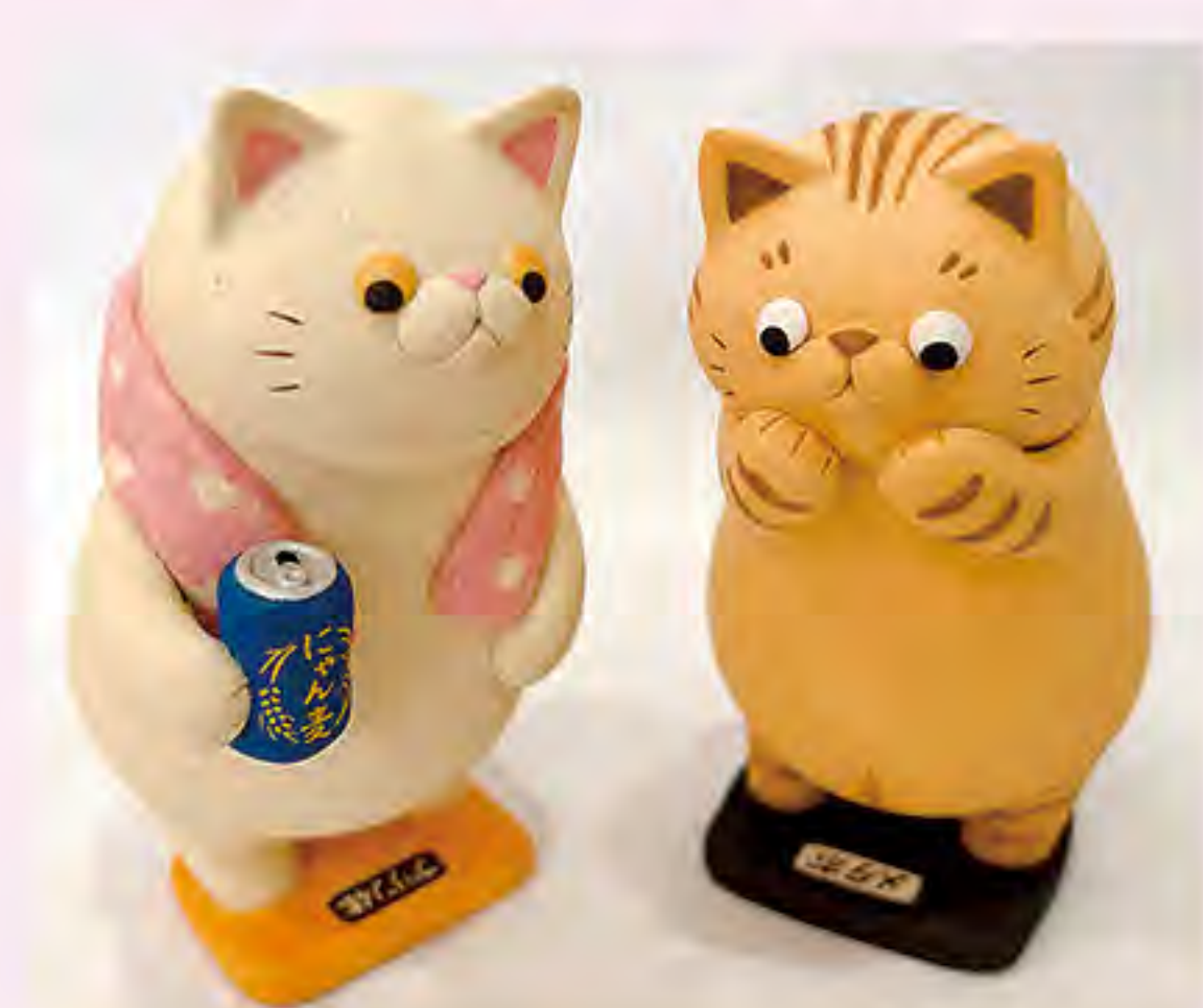
じょあん (出品のみ)