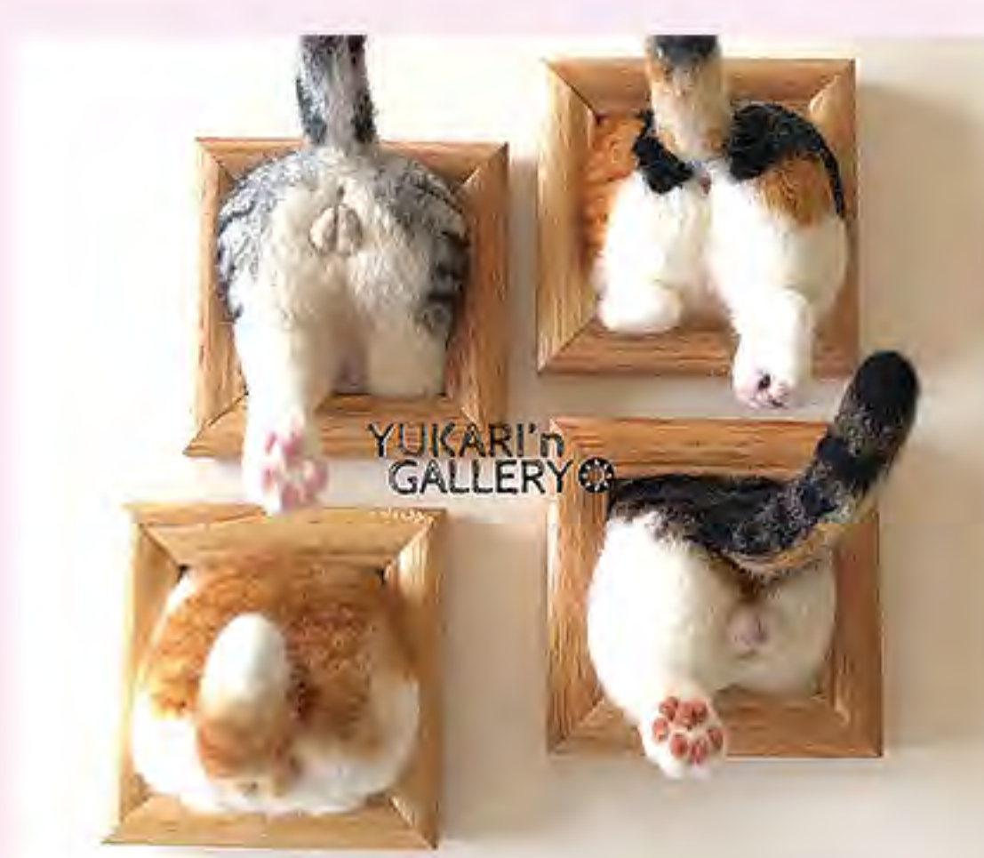
YUKARI'n GALLERY (出品のみ)