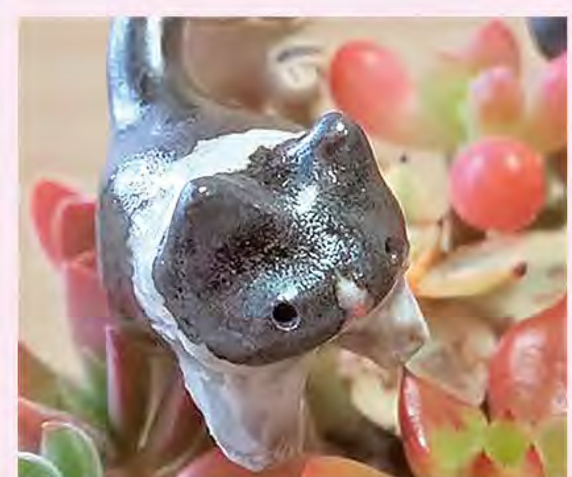
葉ppyぷらんつ (23日・24日)