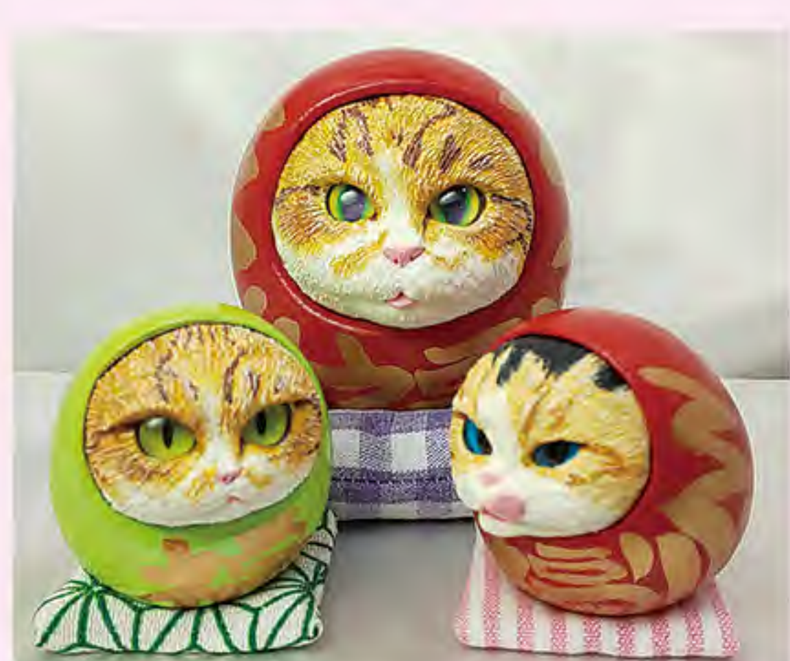
empty can (24日・25日)