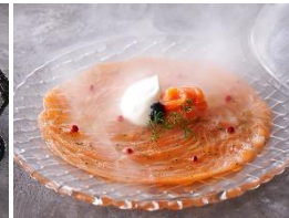
スモークサーモンのマリネ