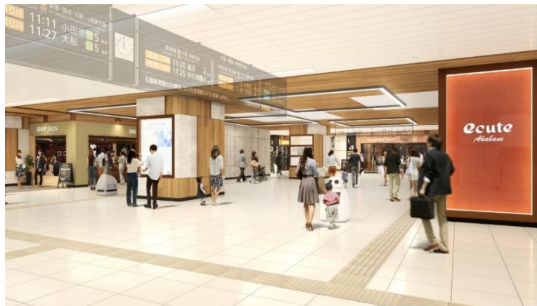
<開発後 南改札内イメージパース>

日々の通勤通学での利用が多い赤羽駅において、日常がより心地よくスムーズにつながっていくよう、乗換時間を「スムーズに！スマートに！快適に！」過ごしていただけるサービス・空間を提供します。