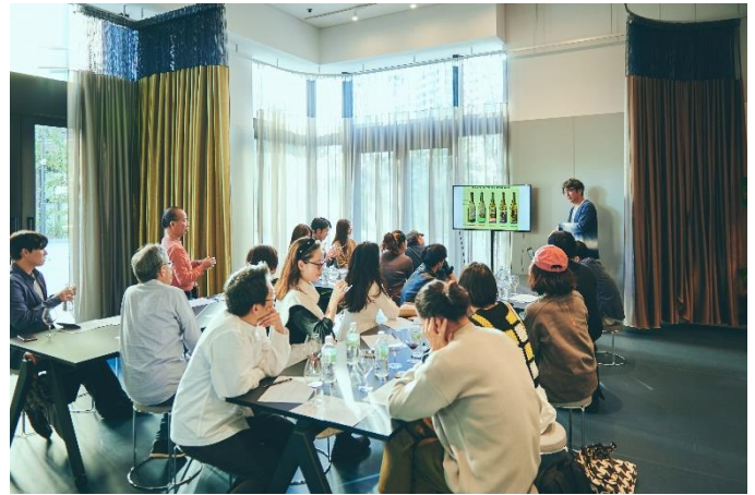
MEGURO MARC におけるイベントの様子