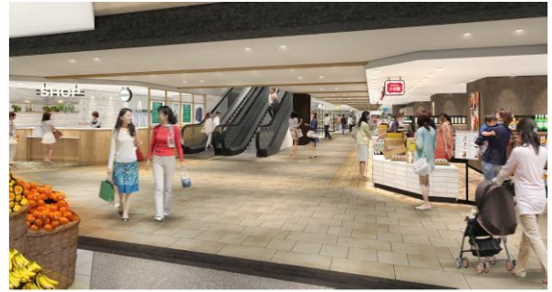
<東京側地下1階エスカレーター付近 イメージ>

また、ベビールームとお客さま用エレベーターを新設し、さらなる利便性向上を目指します。