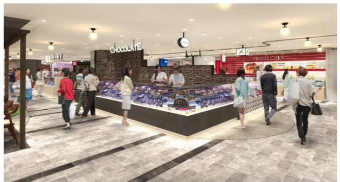
<東京側1階スイーツゾーン イメージ>