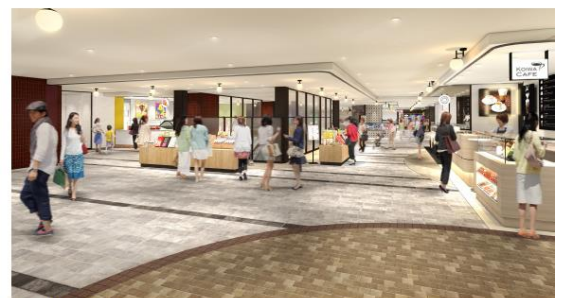
<東京側1階エスカレーター付近 イメージ>

リニューアル前に分散していたスイーツショップを東京側エリア1階に集積します。地域の皆さまからご要望いただいていた、洋菓子・カフェ業種を増やし、思わずシェアしたくなるギフトや、ほっと一息つく場所など、特別な日にも日々の生活にも彩りを加えます。またスイーツゾーンの先は、レディスファッション・ファストフードなど毎日ふらっと立ち寄りたくなる、楽しいお買いもの道が続きます。