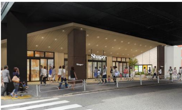
<東京側エントランス イメージ>