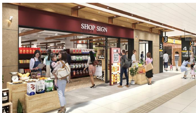
< エキュート赤羽みなみ イメージ② >