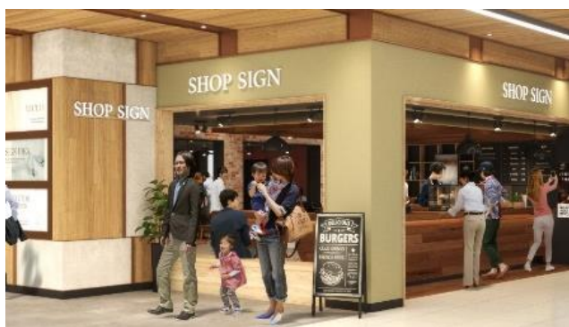
< エキュート赤羽みなみ イメージ① >