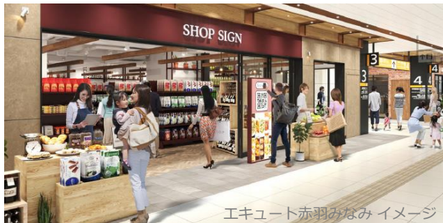
エキュート赤羽みなみ イメージ

■ 特設サイト https://www.ecute.jp/akabane/minami_open/