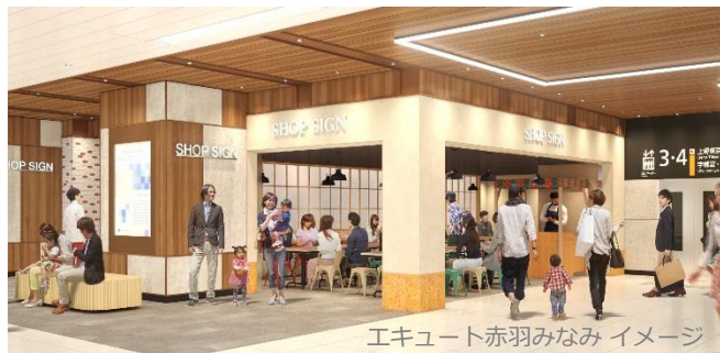
エキュート赤羽みなみ イメージ

JR 東日本グループでは「Beyond Stations 構想」に基づき、暮らしとつながる新しいサービスの提供を通じ、心豊かな「くらしづくり」を実現していきます。