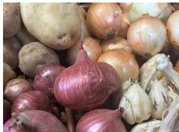
Seijo Bio (8/31出店) 自然栽培を取り入れた土づくりに取り組み、農薬や化学肥料を使わない農業を追求しています。