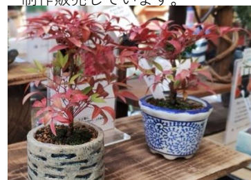
丸園 (両日出店) 盆栽には関心があるが敷居が高いという方のために、日頃の世話や手入れがしやすい樹種を揃えています。