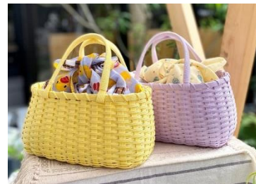
Mammy's♥Craft (8/31出店) 再生紙で作られたカラフルなテープを使って、小物やカゴなどのインテリア雑貨やバッグを制作販売しています。