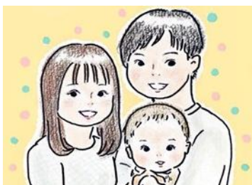
似顔絵しなりお堂 (両日出店) あえて特徴を誇張せず、ふんわりと雰囲気をとらえた似顔絵をお描きします。