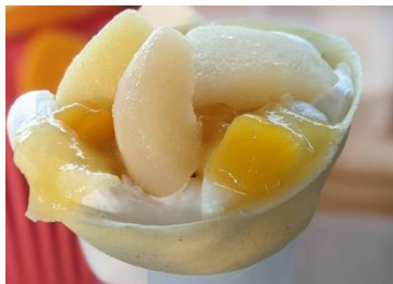
Mnico kitchen (8/31出店) 定番のチョコやキャラメルを始め、手作り白玉や季節毎の果物を使ったクレープも豊富です。