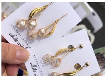
white witch (9/1出店) 「キラキラな毎日をアクセサリーでお手伝いします」をコンセプトに一つ一つ丁寧に手作りにしています。