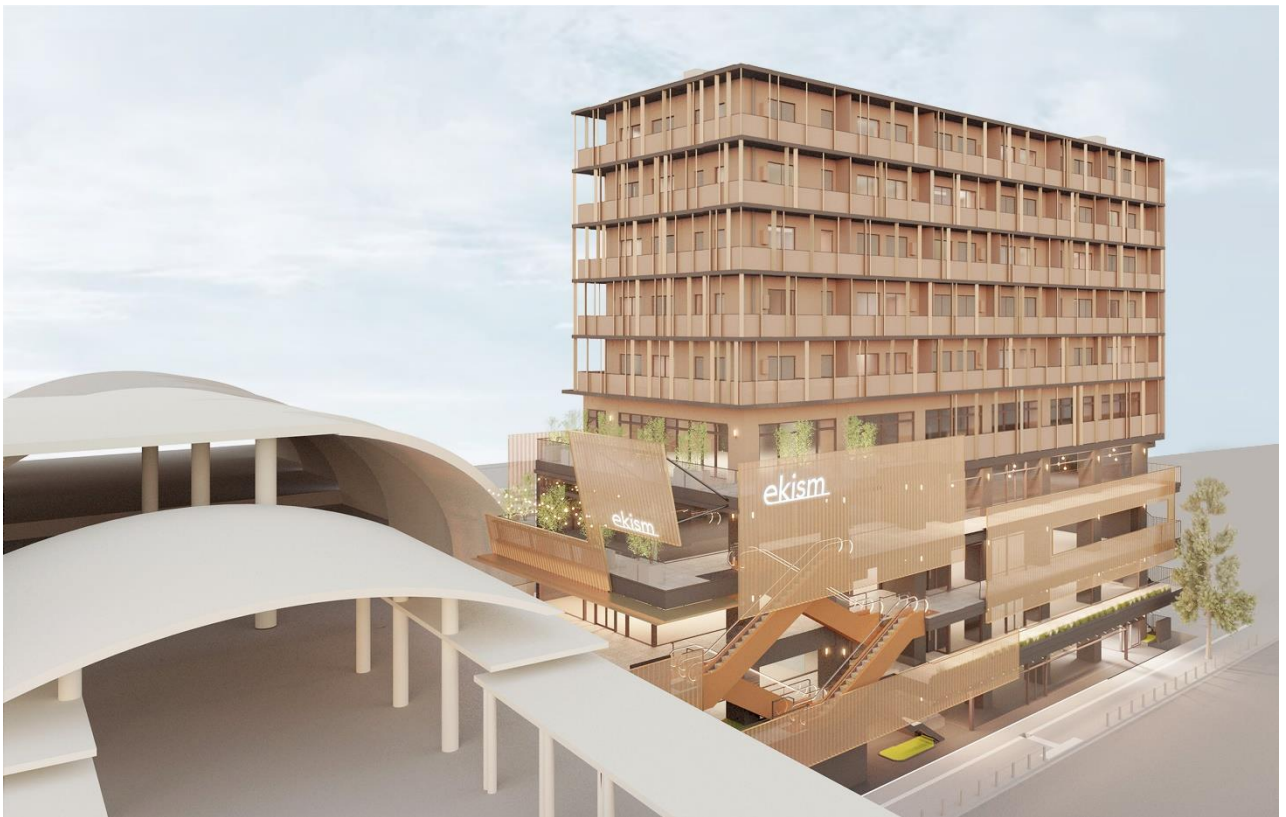
建物完成イメージ