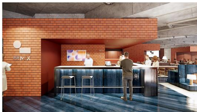
DENTSU LIVE INC. & TAKEARCHITECTS Co., Ltd. (テイクアーキテツク)

円と四角という対照的かつ原始的な図形の組合せで、違ったバックグラウンドの人の出会いを表現しています。また、異なるものが混ざり合う瞬間は、渋沢翁が「論語と算盤」にて説いた道徳と経済の両立、自分と他者における「忠恕」の精神も示唆しています。さらに、青色の円とルビ色の四角は渋沢翁を想起させる藍玉といがをモチーフとしています。