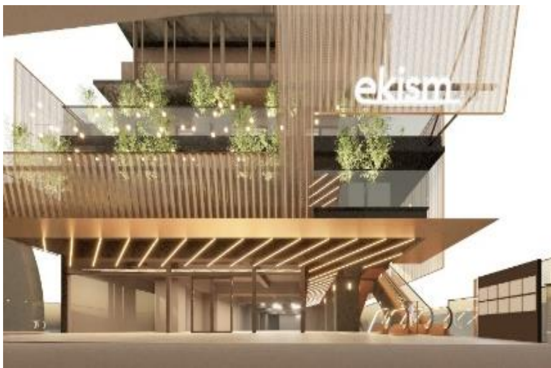
駅コンコース側(3F)からのイメージ

また、建物外観は成瀬・猪熊建築設計事務所のデザイン監修であり、上層部(住宅)にルーバーと腰壁を、低層部(商業)に有孔折板を設置することで、住宅のプライバシーを守りながら、商業の賑わいが全体に表出するデザインとなっております。