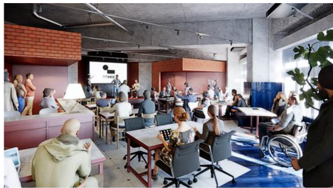
DENTSU LIVE INC. & TAKEARCHITECTS Co., Ltd. (テイクアーキテツク)