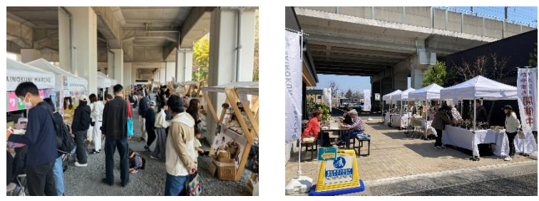
▲前回イベント時の様子 (左；第1会場、右；第2会場)

第1会場の詳細はこちら； Saikyo 40th Celebration Style 第1会場：高架下 | 彩の国マルシェ SAINOKUNI MARCHE 第2会場の詳細はこちら； Saikyo 40th Celebration Style 第2会場：かやまち | 彩の国マルシェ SAINOKUNI MARCHE