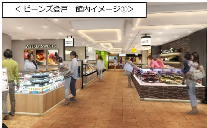
< ビーンズ登戸 館内イメージ① >