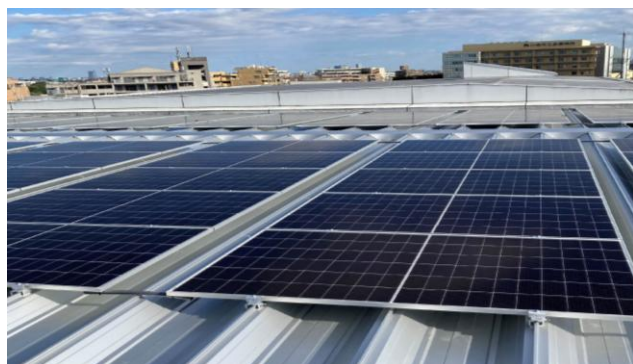
<設置した太陽光パネル>

※BELS（建築物省エネルギー性能表示制度）：建築物の省エネルギー性能の評価及び表示を機関が公正かつ適確に実施することを目的とした、表示告示で規定される第三者による評価制度。