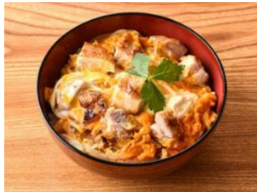
鶏むら あぶり焼き親子丼・鶏かつ丼 （注文販売）