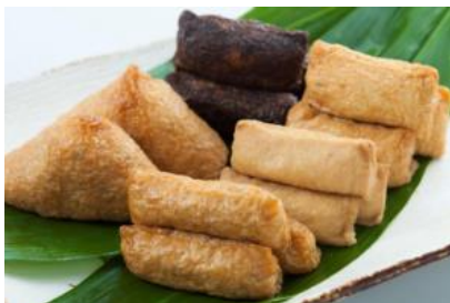
豆狸（まめだ） 千葉県産地鶏のいなりずし