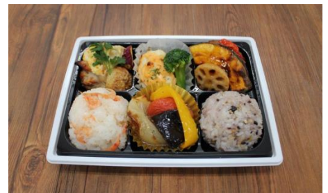
eashion(イーション) 豆腐ハンバーグ重