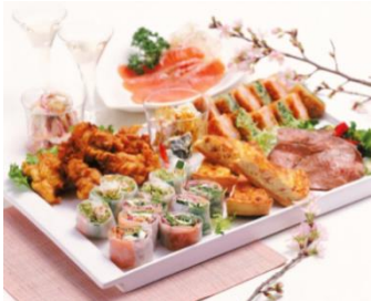
グリーン・グルメ 和×洋×アジアセット