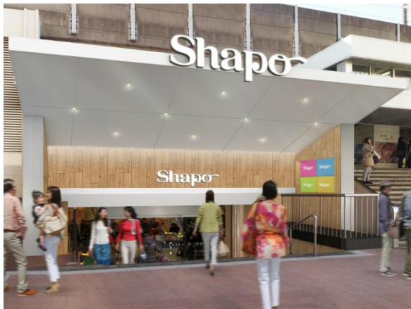
北側エントランスイメージ

株式会社ジェイアール東日本都市開発が運営するショッピングセンター「シャポ一本八幡」（JR総武線 本八幡駅直結）は、2017年4月5日（水）に第3期リニューアルオープンします。