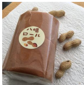
三原堂本店 八幡ロール