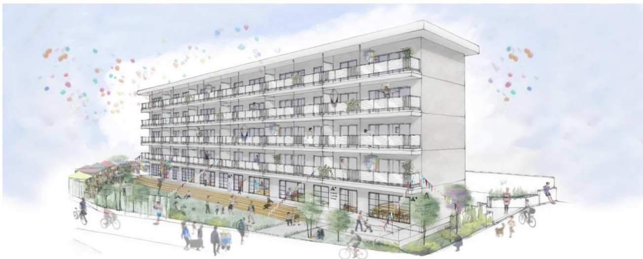
A棟イメージパース