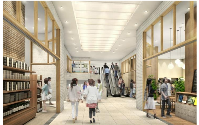
〈1階 吹き抜けイメージ〉