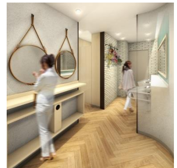
〈1階女性用トイレ内イメージ〉

会社に行く前に、デートの前に、地元の飲み会の前に、ちょっと立ち寄って気分をあげる場所。