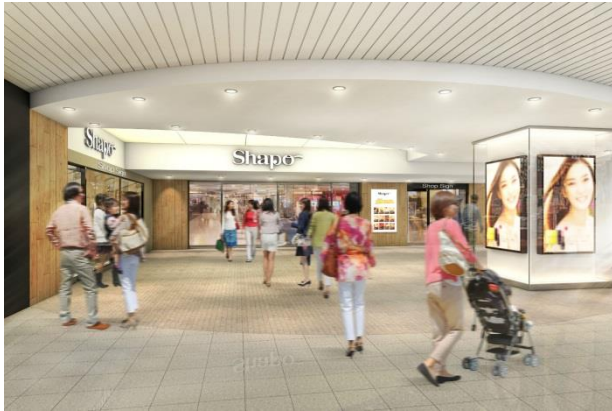
〈2階 エントランスイメージ〉

株式会社ジェイアール東日本都市開発が運営するショッピングセンター「シャポ一本八幡」（JR総武線 本八幡駅直結）は、2017年6月19日（月）に26店がオープンします。