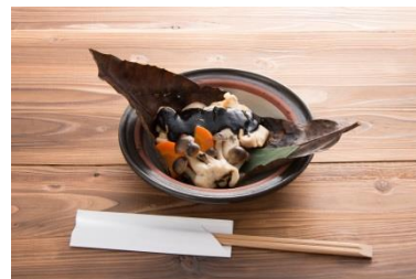
黒さつま鶏純米粕漬け 黒ほう葉味噌焼き (門前茶屋 成る口)