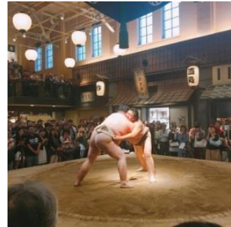
過去の相撲パフォーマンスの様子