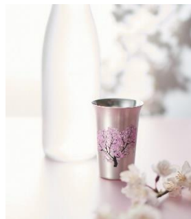
▲まどろむ酒器 (5,500円) (NIIGATA 100)