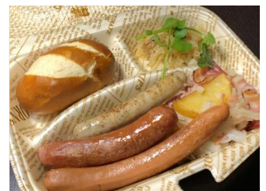
▲ドイツ欲張りプレート (1,100円) (ジェーエス・レネップ～hanare～)

うま味たっぷりの鶏がらのお出汁でさっぱりと温まる一品。自家製の軟骨入り鶏団子やシャキシャキの水菜と白髪ねぎもアクセントになり、そそその不動の人気そうめんです。