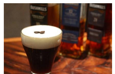
▲アイリッシュコーヒー (800円) (MIXOLOGY HERITAGE.)