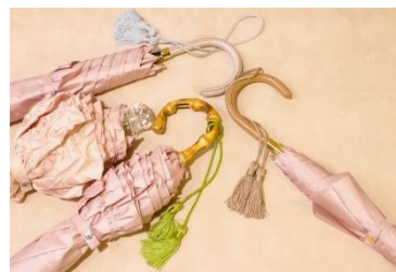
▲サクラ×ノーブル (Tokyo noble*)

華やかな上質な甘みで、後味に桜の香りがふわり。山に咲く桜の美しい情景が浮かびます。