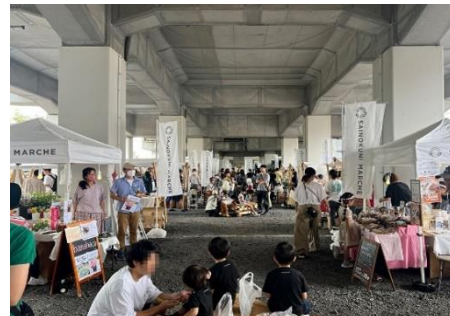
前回（2023年9月実施）マルシェの様子