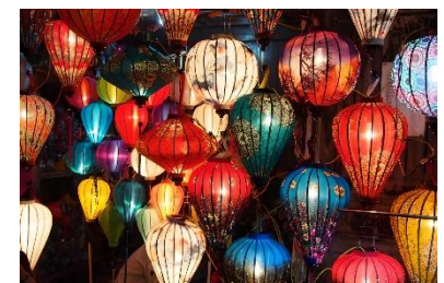
ホイアン旧日本人街

黄色い歴史的な建築物が建ち並び、まるで昔のベトナムにタイムスリップしたようなレトロな雰囲気を感じられるホイアン旧市街。夜になるとランタンが灯り、昼間とは違った幻想的な景色に変化する。特に、1593年に日本人が架けたとされる「来遠橋（日本橋）」は、日本とベトナムの深い歴史的な繋がりを感じさせてくれる象徴的な存在。