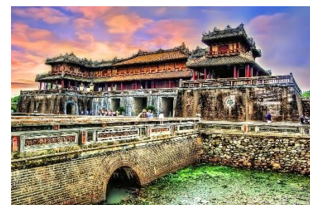
世界遺産フエ王宮