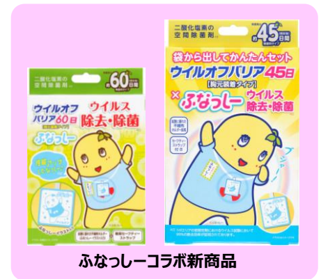
ふなっしーコラボ新商品

大木製薬株式会社（本社：東京都千代田区、代表取締役会長兼社長：松井秀夫）では、二酸化塩素の力を活用して空間を除菌する ※1 「ウイルオフ」シリーズのラインアップ、パッケージを変更し、子会社である販売会社の株式会社ウイルを通して、2015年9月9日（水）からリニューアル発売いたします。また、大人気のゆるキャラ、ふなっしーとのコラボレーション企画として、携帯タイプの「ウイルオフ・バリア 60日 ふなっしー」と「ウイルオフ・バリア 45日 ふなっしー」を同日より新発売。「ウイルオフ・ファン」をお買い上げの方にオリジナルの「ふなっしーマスク」（数量限定）をプレゼントします。