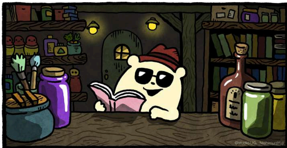
くまっちょアニキ画像

「にしむらゆうじ購買部」で店番として活躍する「くまっちょ一族」から「くまっちょアニキ」が登場！通信販売所に入るとお客様を出迎えてくれます。