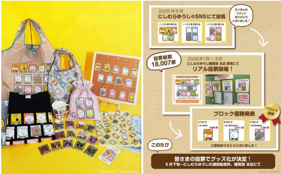
(左) 通信販売所オープン記念「いいカオ選手権グッズ」 (右) にしむらゆうじ購買部 本店 新宿にて実施した いいカオ選手権 (2026年1月～3月実施)

にしむらゆうじのSNS投稿をうけて、東京・新宿の旗艦店「にしむらゆうじ購買部 本店 新宿」にてリアル投票を開催。多くのお客様のご参加を受けてグッズ化が実現しました。