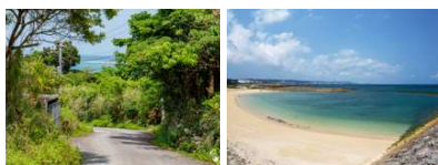
施設周辺は緑に囲まれた場所。 施設の近くには地元のビーチも。

当施設では、宿泊、レンタルスペース+αでウェルネスプログラムが受けられます。企業研修やヨガ教室、ワークショップなど、あなたの好きなカスタマイズされた時間をお過ごしいただけます。サードプレイスとなるサンライズを望む東の古里・南城市の絶景ポイントで俯瞰する思考を手に入れ、楽に生きるための第一歩を踏み出します。