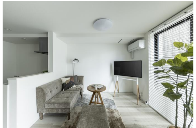
写真：AVANTIA Sage 中島新町

株式会社AVANTIA（本社：愛知県名古屋市、代表取締役社長：沢田康成、以下「当社」）は、不動産経営の統合ソリューション「BizFill System」の初のモデル棟となる「AVANTIA Sage（アバンティア サージュ）中島新町」（名古屋市中川区）において、完成披露先行内覧会を開催いたしました。