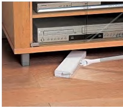
家具と床との隙間