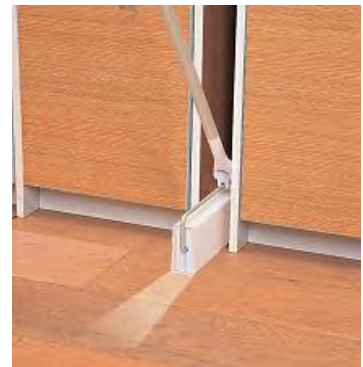
家具と家具との隙間