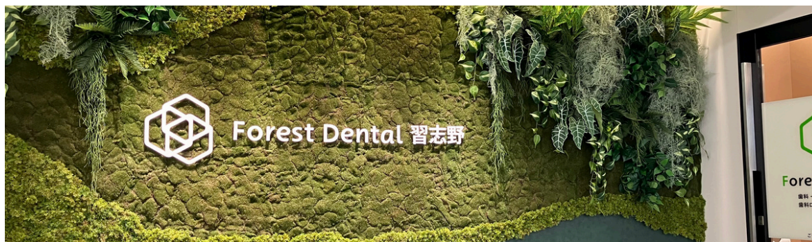
イオンタウン東習志野内、グリーンのモニュメントのある入口でみなさまをお迎えします。