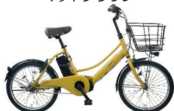
マットマスタード