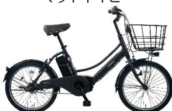
マットチャコール