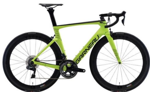
GENNIX A1 COURSE Di2