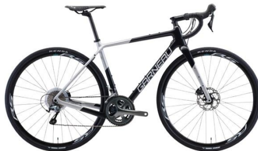
GENERAL ROAD PERFORMANCE