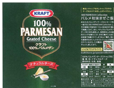
〈ラベルデザイン パルメ秋味ませごはん〉

提供されるメニューのレシピは、クラフトチーズレシピ WEB サイトで公開しています。