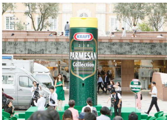
〈前回のイベントで設置されたベンディングマシンの様子〉

「クラフト 100%パルメザンチーズ」のパッケージデザインをそのまま大きくし、高さが同製品(80gサイズの高さ:14.3cm)と比較すると約 32 倍にあたる、4.6mの巨大なベンディングマシンが会場に登場。ベンディングマシンには、300 個のボタンがついており、好きなボタンを選んで押すと 10 種のランチボックスのうち、1 つがランダムに提供されます。また、ベンディングマシンにはランチボックスの残数が表示され、提供に合わせてカウントダウンいたします。