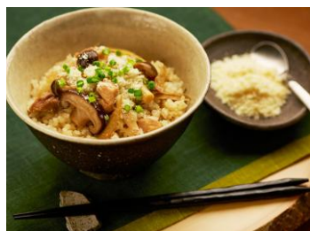
〈秋味パルメ混ぜごはん〉