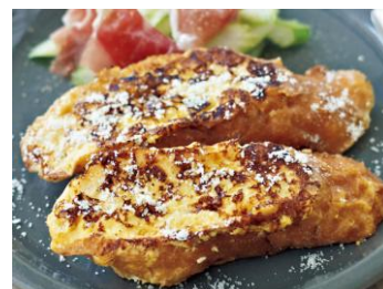
〈パルメチーズフレンチトースト〉