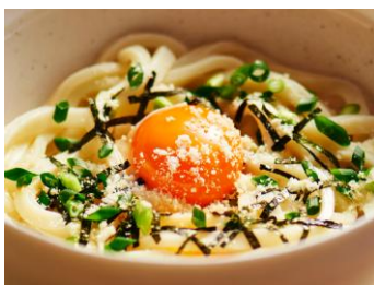
〈パルメ釜玉うどん〉