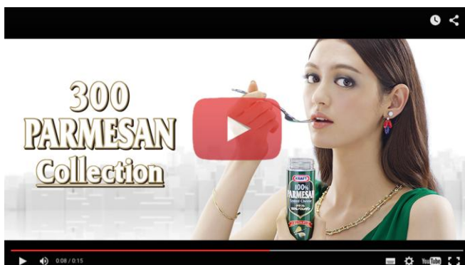
〈オリジナルムービー イメージ〉